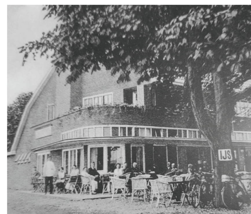
Hotel-café-restaurant Hiersch, het latere café-restaurant De Egelantier. Op deze plaats was begin van de twintigste eeuw Hotel-Café Leeuwenhorst gevestigd.

De naam van het huidige dorp Den Dolder is ontleend aan het gehucht dat aan de Soestdijkerweg ter hoogte van Prins Hendiksoord lag. Dit gehucht wordt in 1650 voor het eerst vermeld als 'Grotten Dolder' en als 'Grote Dolre'. Soms wordt beweerd dat Den Dolder al in een akte uit 1239 wordt genoemd, maar dit is onjuist. In de Tegenwoordige Staat der Vereenigde Nederlanden (1772) wordt een akte uit dat jaar aangehaald.